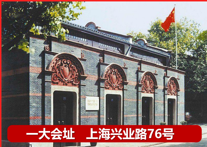
一大会址 上海兴业路76号

1921年7月23日，中国共产党第一次全国代表大会在上海法租界望志路（今兴业路76号）举行，后来由于会场受到暗探的注意和外国巡捕搜查，会议的最后一天（7月31日）改在浙江兴南湖的游船上举行。